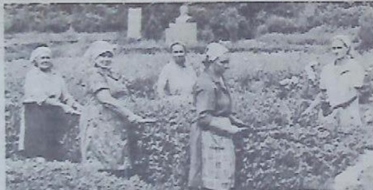
◆ У истоков зарождения «Зари».