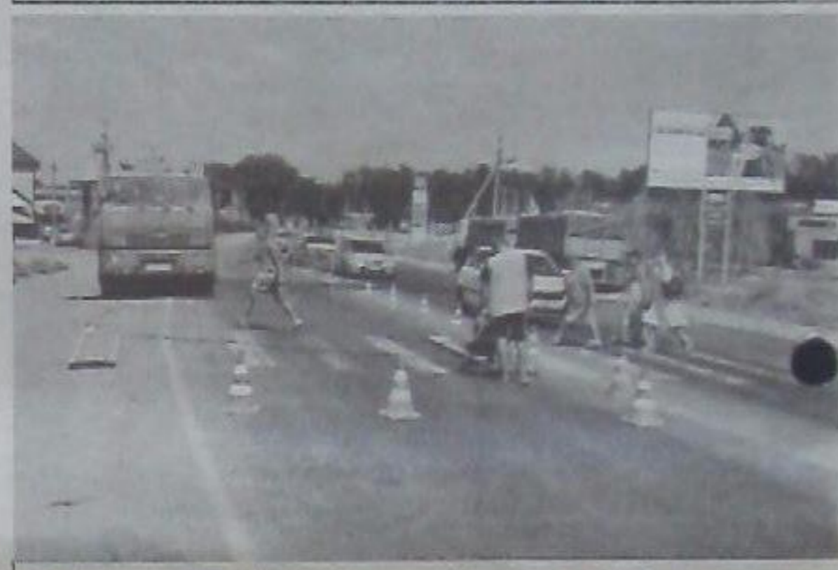
◆ Интенсивное движение по этой трассе не прекращается ни днём, ни ночью.